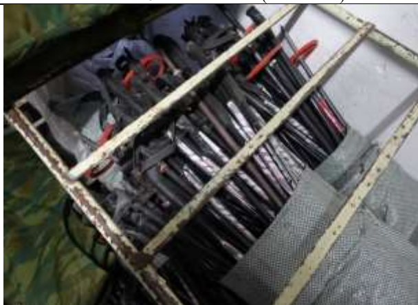
Фото № 12 Лом металлов (алюминия)