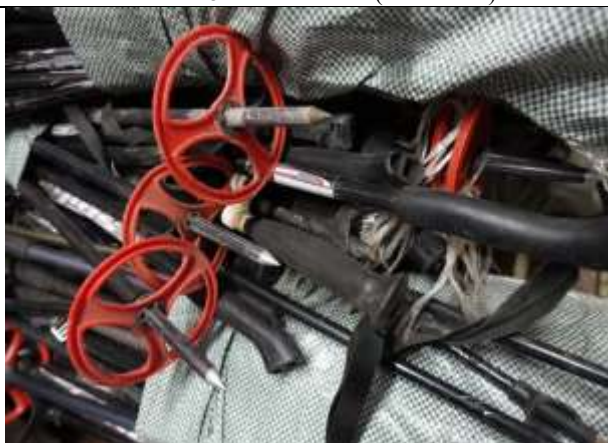
Фото № 10 Лом металлов (алюминия)