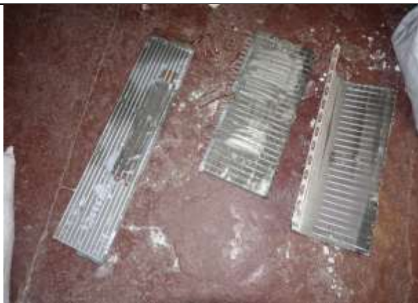
Фото № 6 Лом металлов (меди)