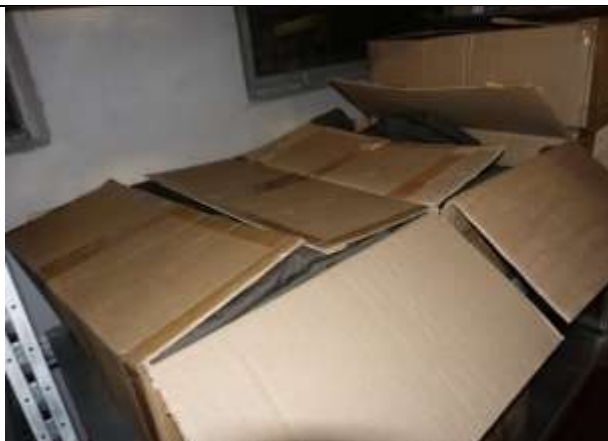
Фото № 5 Объекты оценки