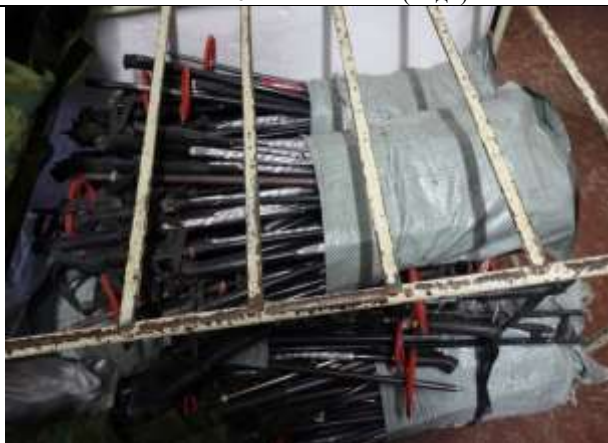
Фото № 8 Лом металлов (алюминия)