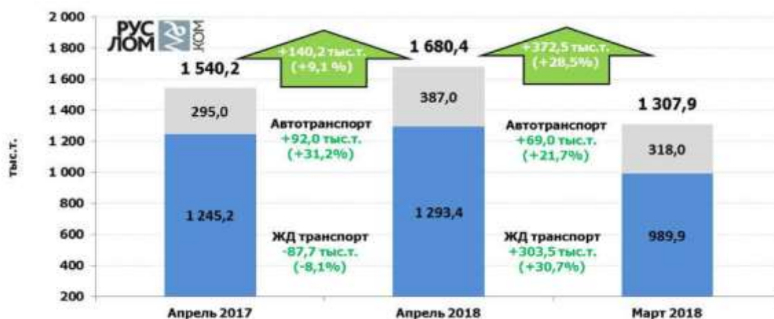
Рис. 1. Отгрузка лома черных металлов в адрес российских потребителей в апреле 2018 г.

Средневзвешенная закупочная цена лома черных металлов (3А, жд транспортом, без НДС) для ключевых предприятий Центрального региона, по итогам апреля 2018 г., составила 16,9 тыс. р./т, для предприятий Уральского региона – 16,4 тыс. р./т.