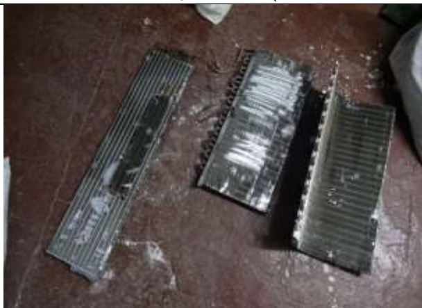
Фото № 7 Лом металлов (меди)