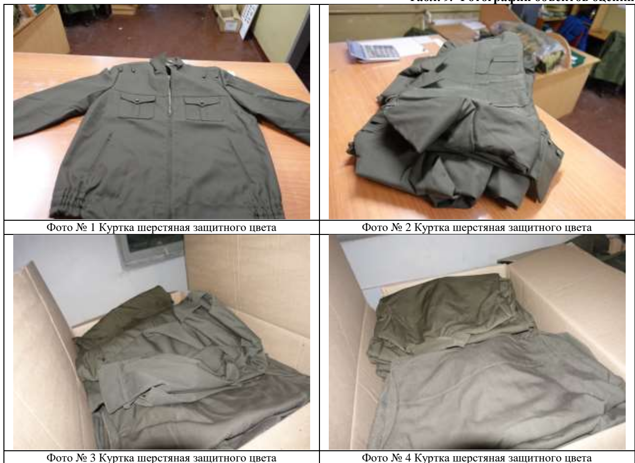
Табл. 9. Фотографии объектов оценки

Визуальный осмотр был проведен помощником оценщика 22 ноября 2018 года (Никулиной Еленой, конт. тел.: 8 (961) 350-67-44) в присутствии представителя Заказчика.