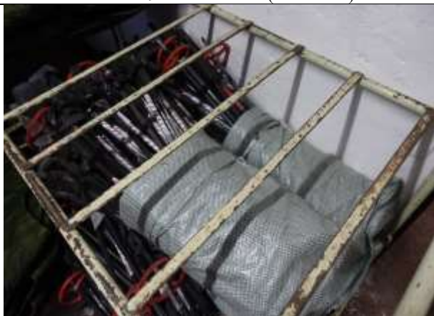
Фото № 11 Лом металлов (алюминия)