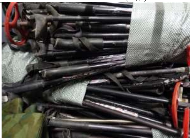
Фото № 9 Лом металлов (алюминия)